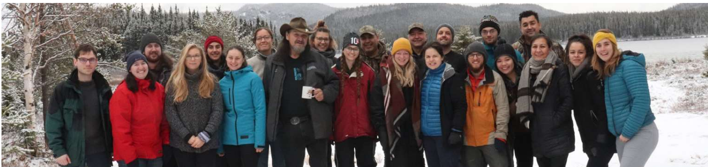
Photo du passage de la Chaire de leadership en enseignement de la foresterie autochtone à Pessamit.