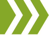
Table des matières